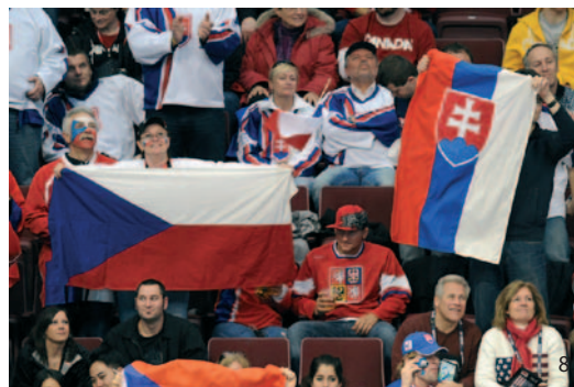
Hokejová družba v hledišti: fanoušci při zápase Česko – Slovensko.