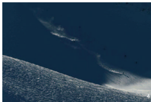
Přes všechny pochybnosti zima ve Whistleru panovala.