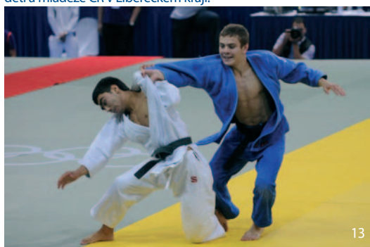
13 Judista David Pulkrábek (vpravo) se v Singapuru stal olympijským vítězem.