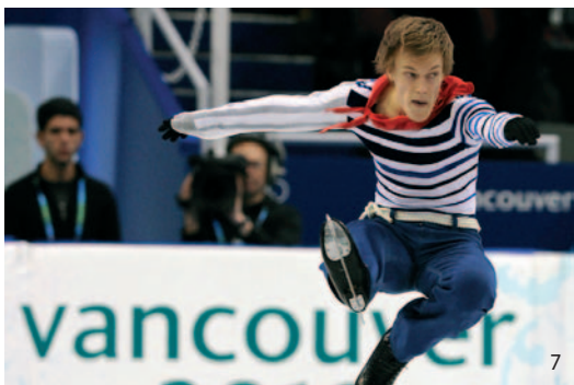
Krasobruslař Tomáš Verner při svém olympijském vystoupení.