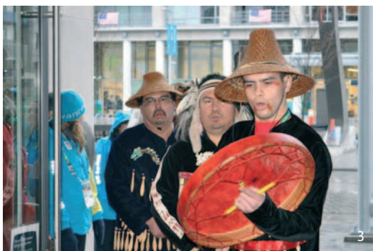
Slavnostní přivítání české výpravy v olympijské vesnici.