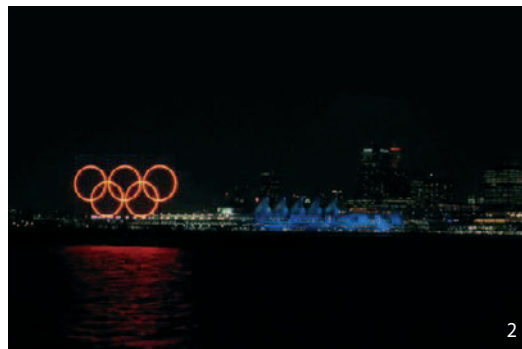
Pohled na noční olympijský Vancouver, krátce před vypuknutím her.