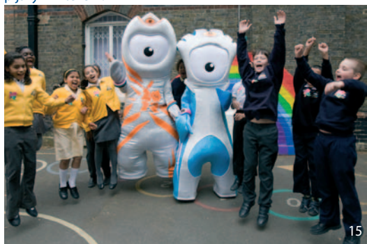
15 V minulém roce odtajnilo organizátoři letních olympijských her v Londýně 2012 oficiální maskoty – Wenlocka a Mandevilla.