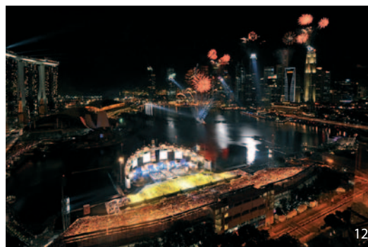
12 Slavnostní zahájení Olympijských her mládeže v Singapuru – srpen.