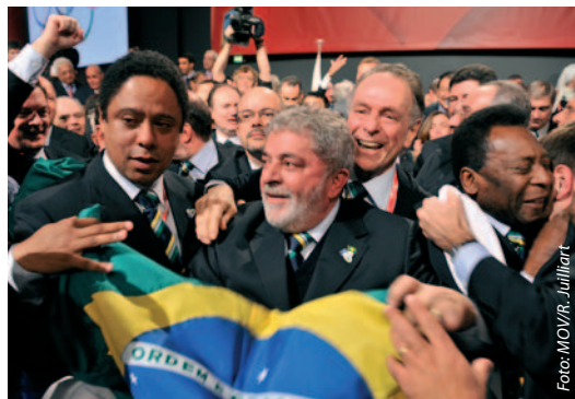
Dnes již bývalý brazilský prezident Luiz Inácio Lula da Silva oslavuje přidělení pořadatelství LOH 2016.

Předseda Mezinárodního olympijského výboru Jacques Rogge položil základní kámen olympijské vesnice v Rio de Janeiro. Stavba začíná oficiálně tento měsíc. Komplex budov vesnice je dimenzován tak, aby pojal 17 700 osob. Vesnice zabírá plochu 75 hektarů, z toho 58 bude zastavěných obytnými budovami, celkem 48 jich bude dvánáctipatrových. Po skončení olympijských her budou apartmány na prodej.