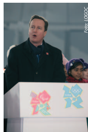
Britský premiér David Cameron na ploše Olympijského stadionu, dominanty Olympijského parku.