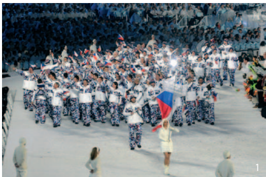
Slavnostní zahájení olympijských her ve Vancouveru.

Hlavní událostí roku 2010 byly bezesporu únorové zimní olympijské hry ve Vancouveru. Pozornosti fotografů však neunikly ani další události – Olympiáda dětí a mládeže v Liberci, Olympijské hry mládeže v Singapuru či příprava na LOH 2012 v Londýně.