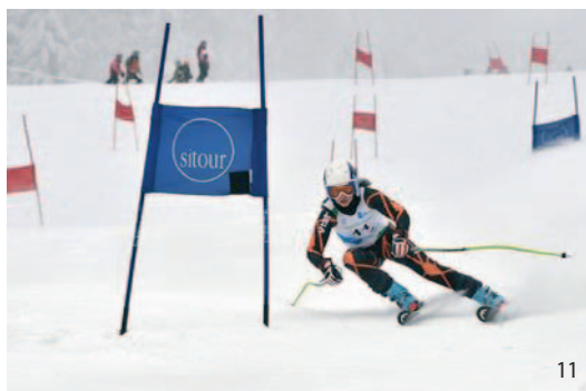
11 Momentka z obřího slalomu z únorových Her IV. zimní olympiády dětí a mládeže ČR v Libereckém kraji.