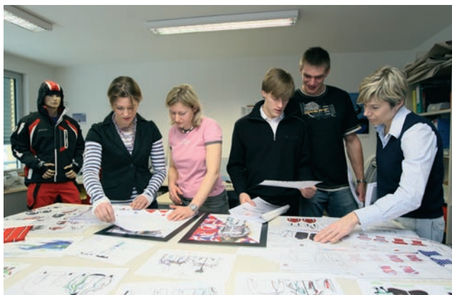
„Módní“ komise nad návrhářským stolem se skicami olympijského oblečení.