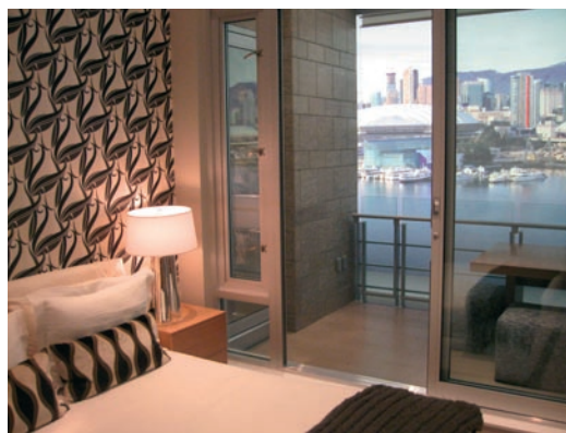
Vizualizace pokoje v olympijské vesnici