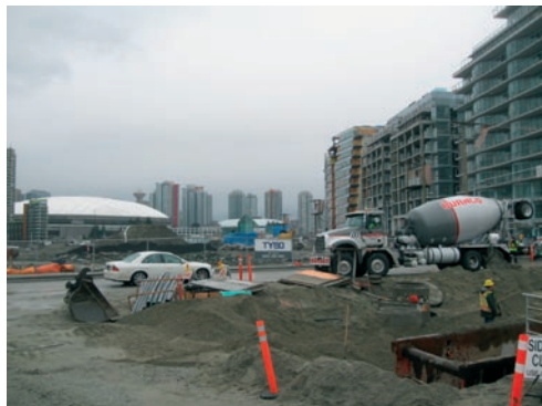
Výstavba olympijské vesnice je v plném proudu.

Ještě zdaleka není hotova, zatím se tu brodíte v bahně, procházíte stavenišťem. Ale už dnes si můžete ve Vancouveru prohlédnout vzorové byty, v nichž budou v únoru 2010 bydlet čeští i další olympionici. Dokonce si je můžete i koupit! Ceny stoupají v přepočtu od 8 milionů korun za jednopokojový byt až ke 100 milionům za luxusní 3+1 s vybavením. Stačí složit 10procentní zálohu, uvázat se k hypotéce a certifikát je váš. Až v březnu 2010 odletí olympionici, novousedlíci se po nezbytných úpravách bytu nastěhují.