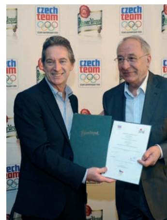
Podpis sponzorské smlouvy s Českým olympijským týmem

V marketingových kampaních určitě budeme využívat naši pozici generálního partnera Českého olympijského týmu. Budeme pokračovat v prezentaci pravého ducha českého olympismu – jako tomu bylo minulý rok s Emilem Zátopkem. Pro spotřebitele připravujeme řadu zajímavých aktivit.