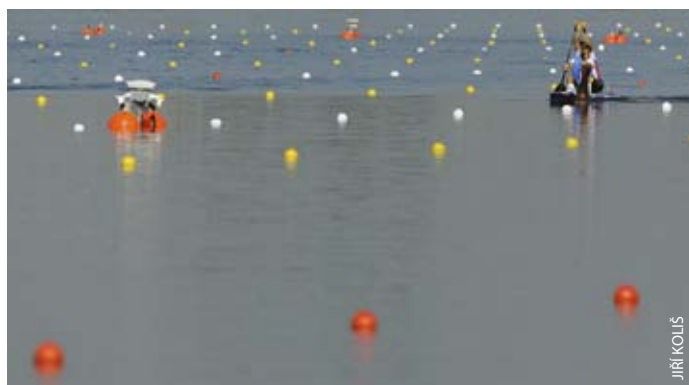
Rychlostní kanoisté Radoň – Dvořák na kanálu Eton Dorney.