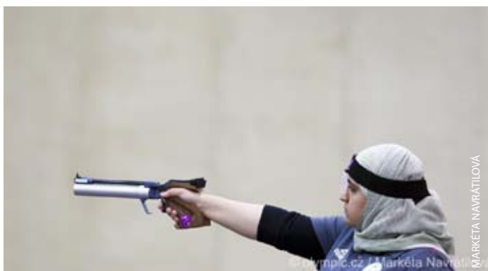
Katar, Saúdská Arábie a Brunej vyslaly poprvé v historii na OH i ženy.