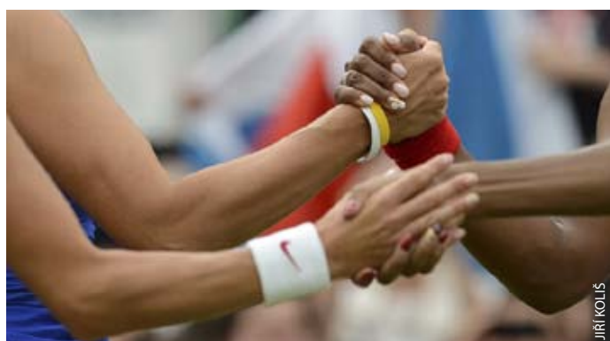
Centrkurt ve Wimbledonu a finále deblu: Duo H+H a sestry Williamsovy.