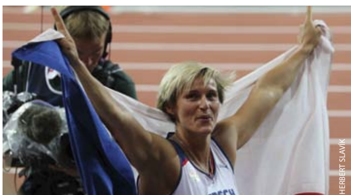
Dvojnásobná olympijská vítězka v hodu oštěpem Bára Špotáková.