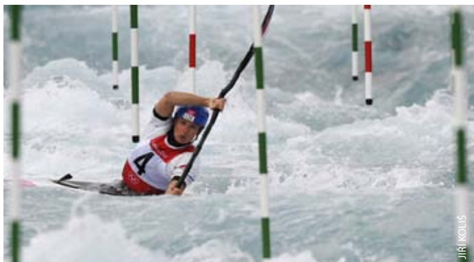
Štěpánka Hilgertová při své poslední olympijské jízdě.